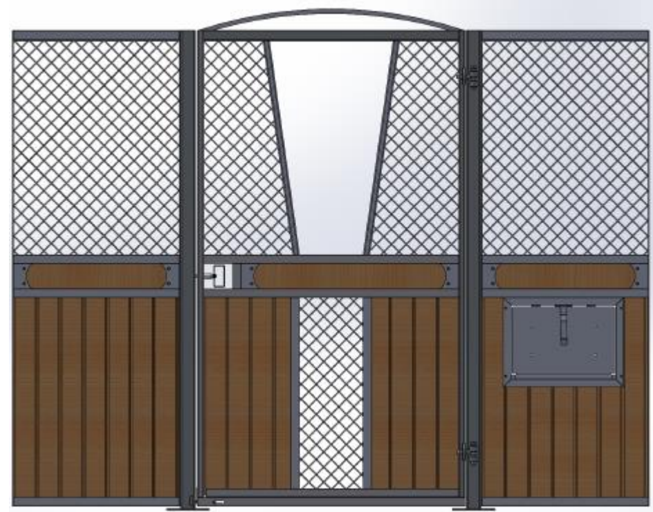
Samma front som till vänster där man har hakat av den V formade luckan.

Ruter Kung med stående ruter, säkerhetstestat med simulerad hästspark, slagdörr, massor av möjligheter; dekorationsbräda, båge eller rakt stycke över dörren, ljusinsläpp i fronten, V formad lucka i dörren som kan hakas av, vippkrubba, ek och plastplank, svartlack. Kan matchas med låga Ruter Dam.