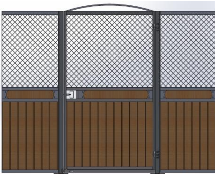
Galvad med granplank, dekorationsbräda, båge över dörr.