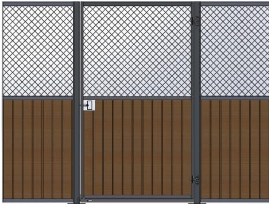
Modell bas. Galvad med granplank.