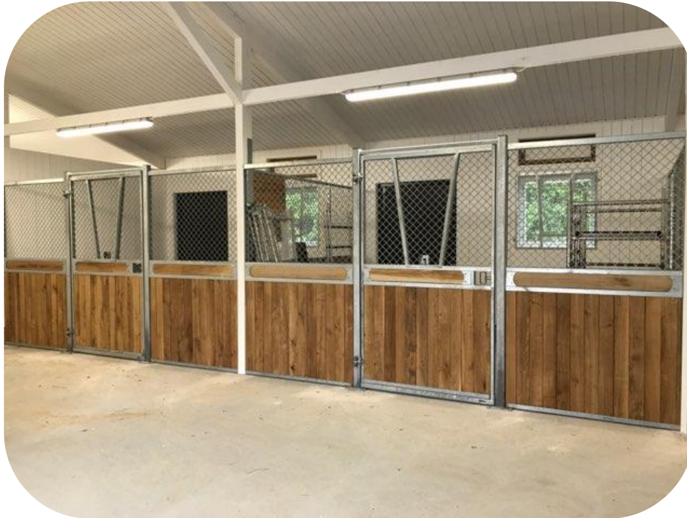
Ruter Kung med V formad lucka i fronten, dekorationsbräda, ekplank. Notera detaljer som matchningen med fönster och fönsterlucka, den kraftiga ramen och nätet som försvinner bort och knappt syns.

Ruter Kung med stående ruter, säkerhetstestat med simulerad hästspark, slagdörr, massor av möjligheter; dekorationsbräda, båge eller rakt stycke över dörren, ljusinsläpp i fronten, V formad lucka i dörren som kan hakas av, vippkrubba, ek och plastplank, svartlack. Kan matchas med låga Ruter Dam.