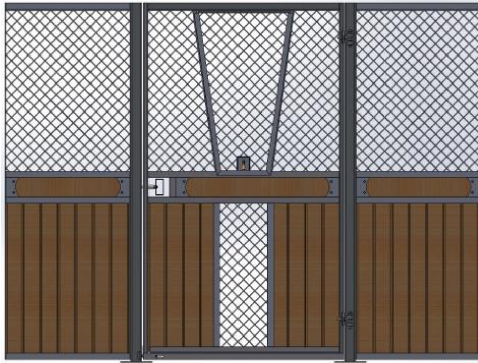
Galvad med granplank, dekorationsbräda, Ljusinsläpp i front. V-front i dörr som går att haka av.