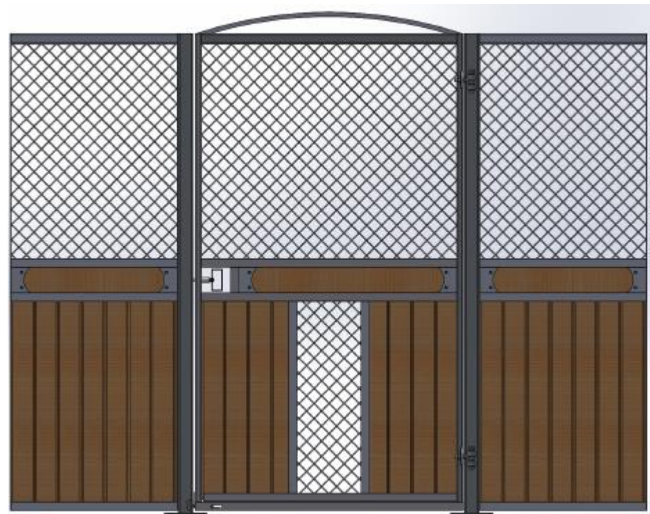
Galvad med granplank, dekorationsbräda, båge över dörr. Ljusinsläpp i front.

Ruter Kung med stående ruter, säkerhetstestat med simulerad hästspark, slagdörr, massor av möjligheter; dekorationsbräda, båge eller rakt stycke över dörren, ljusinsläpp i fronten, V formad lucka i dörren som kan hakas av, vippkrubba, ek och plastplank, svartlack. Kan matchas med låga Ruter Dam.