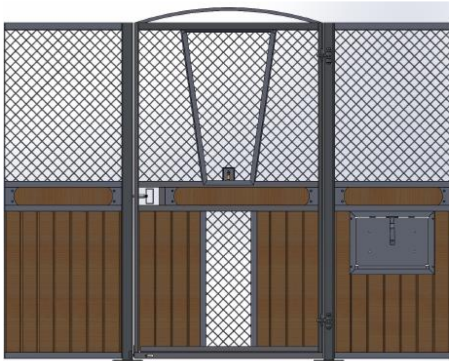
Galvad med granplank, dekorationsbräda, båge över dörren, ljusinsläpp i front. V-front i dörr som går att haka av. Vippkrubba.