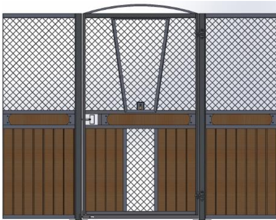
Galvad med granplank, dekorationsbräda, båge över dörren, ljusinsläpp i front. V-front i dörr som går att haka av.