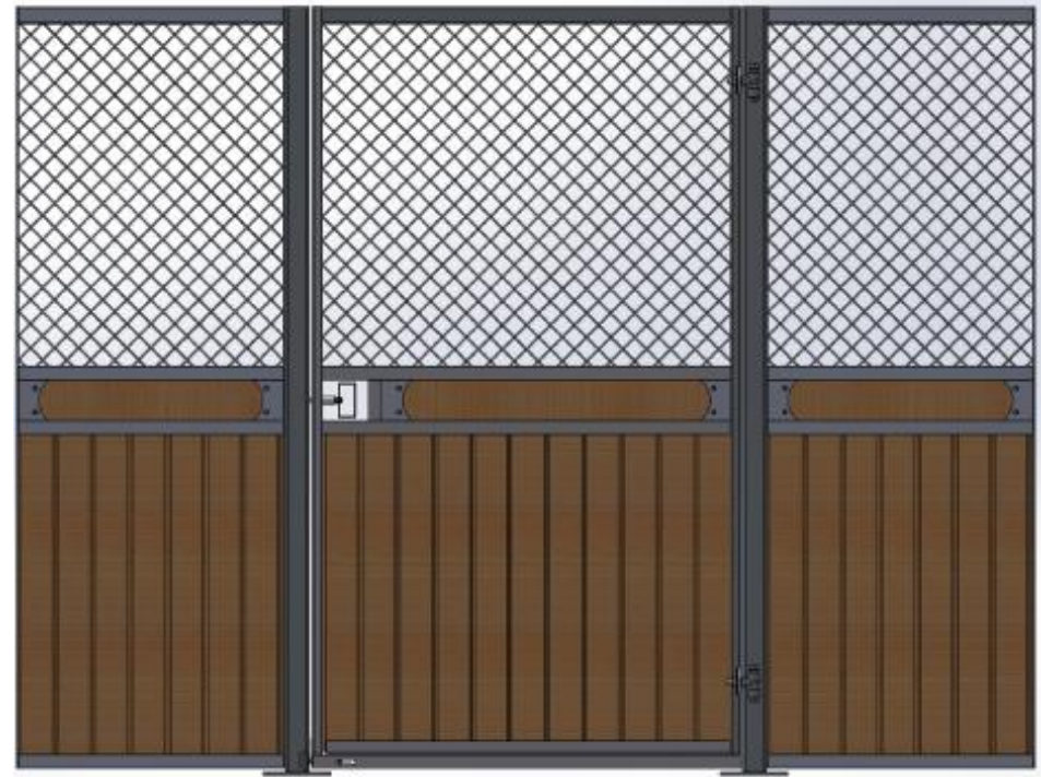
Galvad med granplank, dekorationsbräda.

Ruter Kung med stående ruter, säkerhetstestat med simulerad hästspark, slagdörr, massor av möjligheter; dekorationsbräda, båge eller rakt stycke över dörren, ljusinsläpp i fronten, V formad lucka i dörren som kan hakas av, vippkrubba, ek och plastplank, svartlack. Kan matchas med låga Ruter Dam.