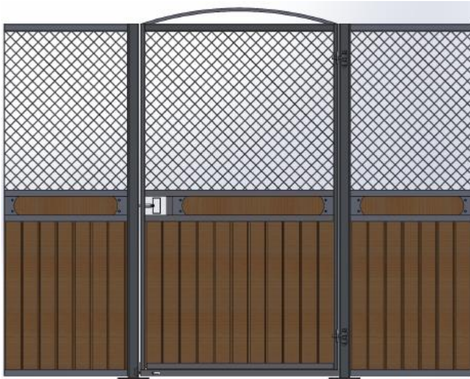
Galvad med granplank, dekorationsbräda, båge över dörr.