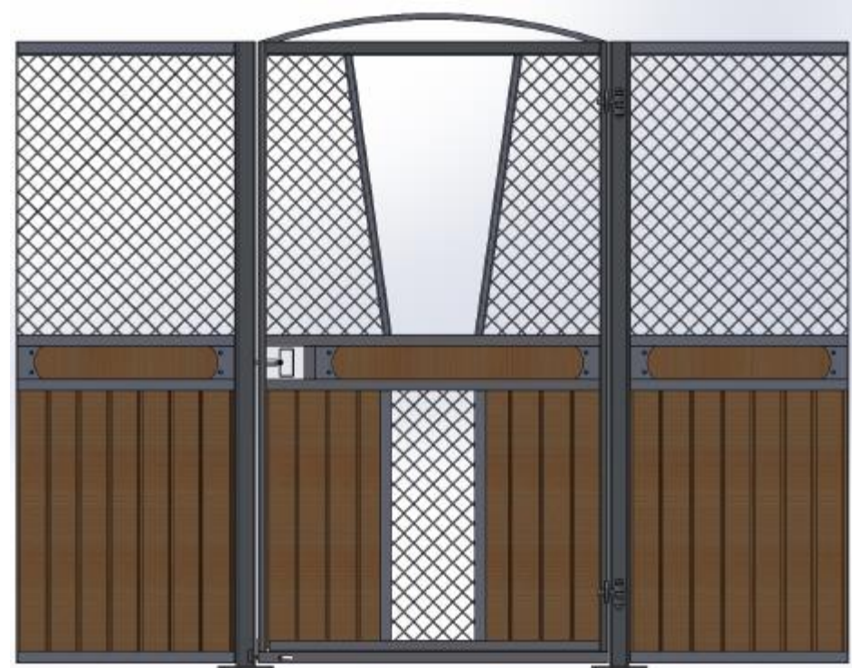
Samma front som till vänster där man har hakat av den V formade luckan.

Ruter Kung med stående ruter, säkerhetstestat med simulerad hästspark, slagdörr, massor av möjligheter; dekorationsbräda, båge eller rakt stycke över dörren, ljusinsläpp i fronten, V formad lucka i dörren som kan hakas av, vippkrubba, ek och plastplank, svartlack. Kan matchas med låga Ruter Dam.