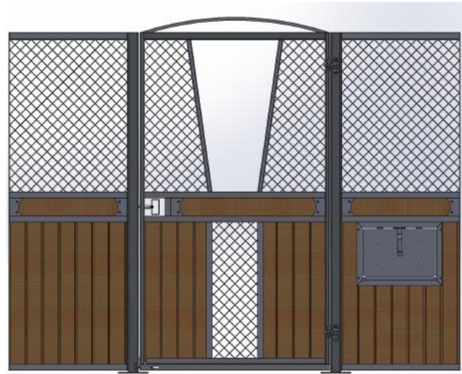
Samma front som till vänster där man har hakat av den V formade luckan.

Ruter Kung med stående ruter, säkerhetstestat med simulerad hästspark, slagdörr, massor av möjligheter; dekorationsbräda, båge eller rakt stycke över dörren, ljusinsläpp i fronten, V formad lucka i dörren som kan hakas av, vippkrubba, ek och plastplank, svartlack. Kan matchas med låga Ruter Dam.