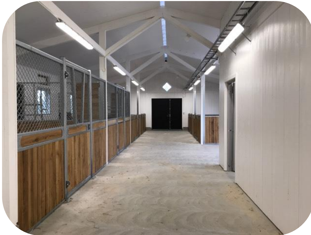
Bruksbalkens stall med 3 meter bred stallgång. 4 boxar Ruter dam och 2 boxar Ruter Kung med avtagbar lucka i fronten. Ekplank och dekorationsbräda

Ruter Dam med är en låg modell med slagdörr, 120 cm alt 145 cm, som matchar i första hand Ruter Kung men kan även bli snygg tillsammans med Ruter Knekt. Rutnät, säkerhetstestad med simulerad hästspark, helt utan nät, slagdörr, massor av möjligheter; dekorationsbräda, ljusinsläpp i fronten, ponnymodell, ek och plastplank, svartlack.