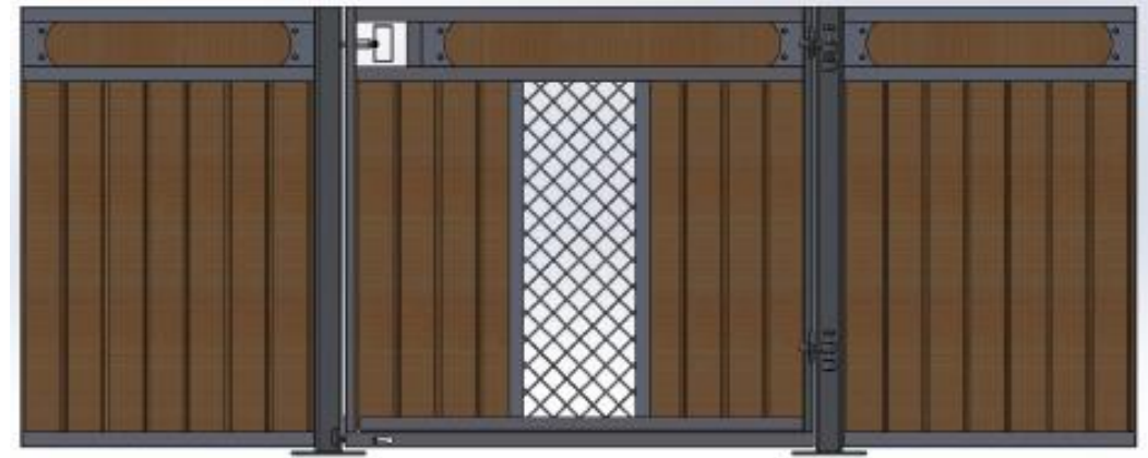
Galvad med granplank, dekorationsbräda, ljusinsläpp i front. Ponnymodell.

Ruter Dam med är en låg modell med slagdörr, 120 cm alt 145 cm, som matchar i första hand Ruter Kung men kan även bli snygg tillsammans med Ruter Knekt. Rutnät, säkerhetstestad med simulerad hästspark, helt utan nät, slagdörr, massor av möjligheter; dekorationsbräda, ljusinsläpp i fronten, ponnymodell, ek och plastplank, svartlack.