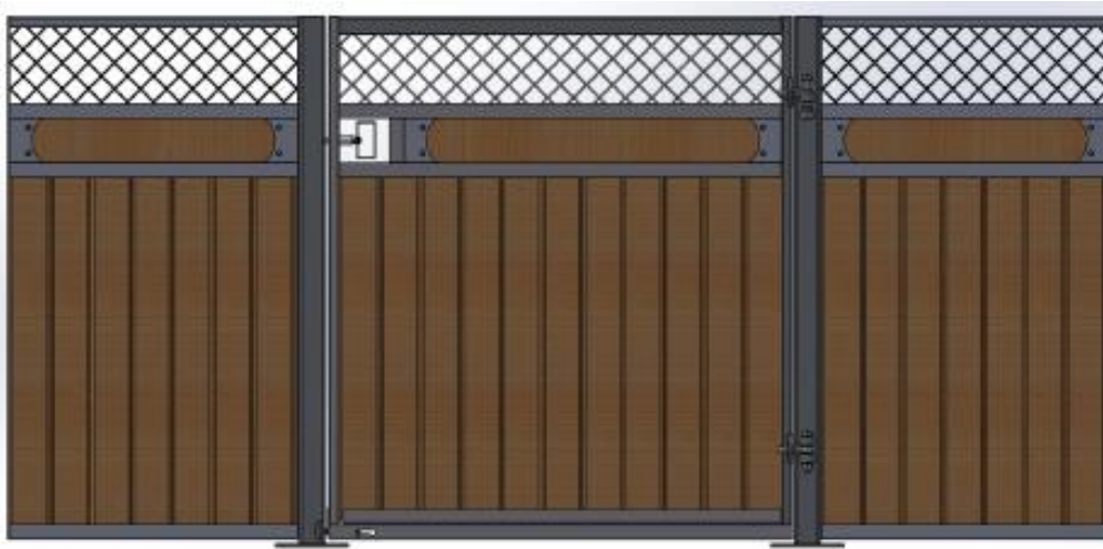
Galvad med granplank, dekorationsbräda