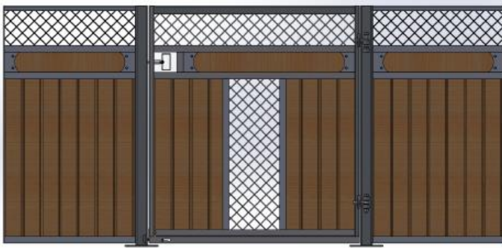
Galvad med granplank, dekorationsbräda, ljusinsläpp i front.