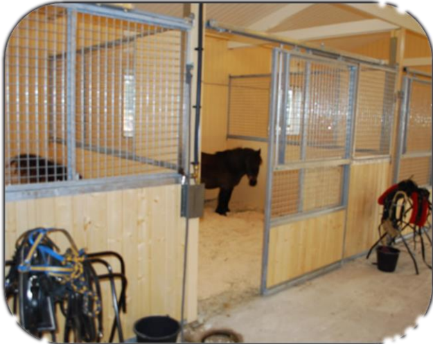
Trygga – ponnyutförande. Fyllning granplank.