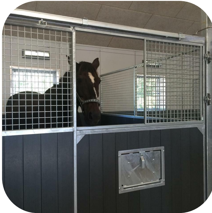
Trygga med plastplank på Örestads Ridklubb. Här har man valt helt öppningsbara fronter samt vippkrubba.

Basmodellen på Trygga är helsvetsad med skjutdörr och har 42 mm granfyllning. Skjutdörren öppnas med en stång som gör det enkelt att öppna dörren både utanför och inuti boxen.