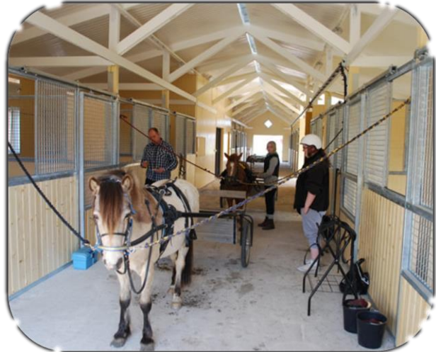
Trygga i Bruksbalkens travstall