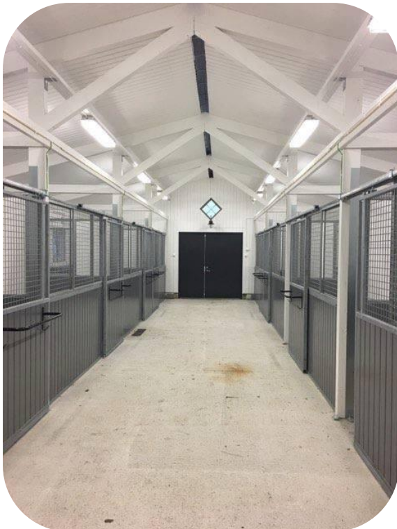
Trygga med granfyllning målad med linoljefärg samt skjutbart nät i fronten

1000 mm. Trygga har som standard skjutdörr. Skjutdörren finns även i ponnyutförande. Som tillval kan boxfronten beställas med gångjärn som gör hela sektionen öppningsbar. Vi kan även erbjuda utdragbara mellanväggar och Trygga med slagdörr. Fyllningen är som standard 42 mm gran kvalitet C 18. Det går även bra att beställa fyllning med gran, ek, eller plastplank. Ett annat tillbehör som efterfrågas ibland är vippkrubbor. För att skapa en lugnare miljö mellan boxarna är rutnätlängden som standard 2200 mm i boxmellanväggen. Resterande del har träutfyllnad. Det är möjligt att göra mellanväggarna hela, dvs. utan nät där behov finns.