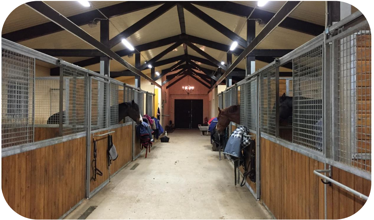
Trygga i Bruksbalkens stall med skjutbart nät i fronten samt ekfyllning