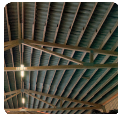
Limmat konstruktionsvirke för upp till 14 m takspann

AB Bruksbalken satsar ständigt nya resurser på produktutveckling. Därför förbehåller vi oss rätten till ändringar i detta produktblad.